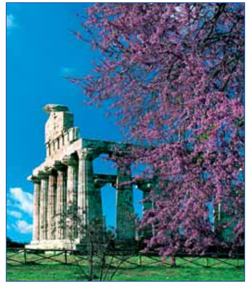
Tal der Tempel - „Schönste Stadt der Sterblichen“

Gleich zu Beginn des Ausflugs erwartet Sie ein grandioser Höhepunkt: der höchste, noch aktive Vulkan Europas - der Ätna oder "Mongibello", wie die Sizilianer liebevoll ihren "Berg der Berge" nennen! Durch Weingärten, karge Berglandschaften und erkaltete Lavaströme nähern Sie sich mit dem Bus dem Vulkan bis zu den "Silvestri Kratern", einer fremdartig anmutenden Mondlandschaft in 1.900 m Höhe. Auf der