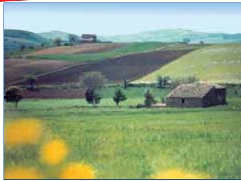
Madonie - einzigartiges Idyll