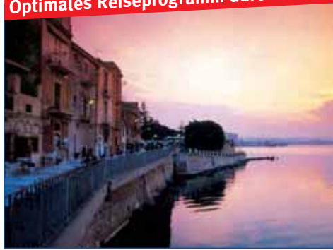
Syrakus - Weltstadt der Antike

Optimales Reiseprogramm durch zwei Hotelstandorte